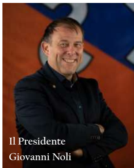
Il Presidente Giovanni Noli

Sono passati dieci anni da quel momento in cui vi siete detti: perché non facciamo una squadra di calcio a 5? Chissà se in cuor vostro sapevate che col passare del tempo sareste diventati una importante realtà calcistica a livello nazionale?